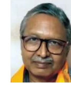
श्री गणपत जी चैन्नई