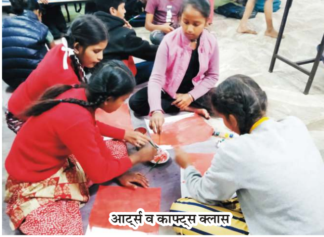
आर्ट्स व काफ्ट्स क्लास

झुग्गी-झोपड़ियों के बच्चों हेतु सायंकालीन अनौपचारिक कक्षा में मूल शिक्षा के अतिरिक्त पाठ्योत्तर कार्यक्रम नियमित रूप से किए जाते हैं, देखिए कुछ झलकियाँ :